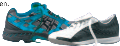
Joggingschuh / Universal-Hallen-Sportschuh

Man sollte sich beim Kauf also gut beraten lassen und die Möglichkeit nutzen, qualitativ hochwertige Auslaufmodelle preisgünstig zu erwerben.