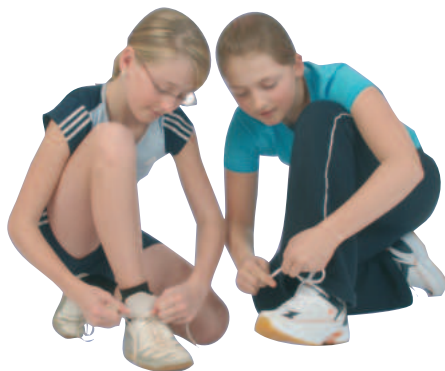
Ideal für den Sportunterricht: Universal-Hallen-Sportschuh (Schulsportschuh)

Sportschuhe, die man im Sportunterricht in der Halle trägt, sollen nicht auf der Straße getragen werden. Sie bringen sonst Schmutz in die Sporthalle, erhöhen dadurch das Unfallrisiko (Rutschgefahr) und die Gefahr der Verbreitung von Krankheitserregern. Wird der Hallensportschuh im Freien benützt, ist vor der weiteren Nutzung in der Sporthalle eine gründliche Reinigung des Schuhs erforderlich.