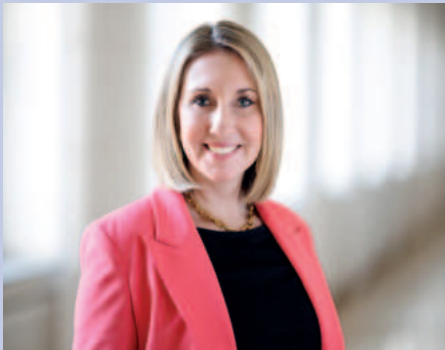
Anna Stolz, MdL Bayerische Staatsministerin für Unterricht und Kultus

Und gerade dadurch leistet der Schulsport einen wichtigen Beitrag zum Auftrag der Schulen, nicht nur Wissen zu vermitteln, sondern genauso auch die Persönlichkeit zu bilden sowie die Entwicklung von Sozialkompetenz und Gemeinschaft zu fördern.